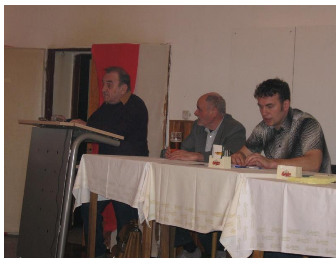
Vystoupení hostů na 91. Výroční schůzi MO ČRS Benátky nad Jizerou

Zejména vystoupení pana starosty bylo velice zajímavé. Úvodem svého projevu dosti podrobně seznámil členy MO s tím, co všechno se podařilo v uplynulém roce vybudovat a jaké projekty město plánuje do budoucna. Zároveň nastínil otázku financování jednotlivých projektů vybudovaných v minulosti a uvedl, že město hospodáří s vyrovnaným rozpočtem. A právě na základě vyrovnaného rozpočtu místním rybářům mimo jiné přislíbil nadále podporu a tak potřebné finanční prostředky nejen na zamýšlené projekty, které připravuje místní organizace, ale i na provoz dětského rybářského kroužku a ostatní aktivity pořádané MO ČRS směrem k mládeži. Poděkoval za dosavadní spolupráci s představiteli výboru tamní organizace ČRS a ubezpečil přítomné, že i nadále bude zastupitelstvo úzce spolupracovat s rybáři místní organizace a podporovat je v jejich úsilí.