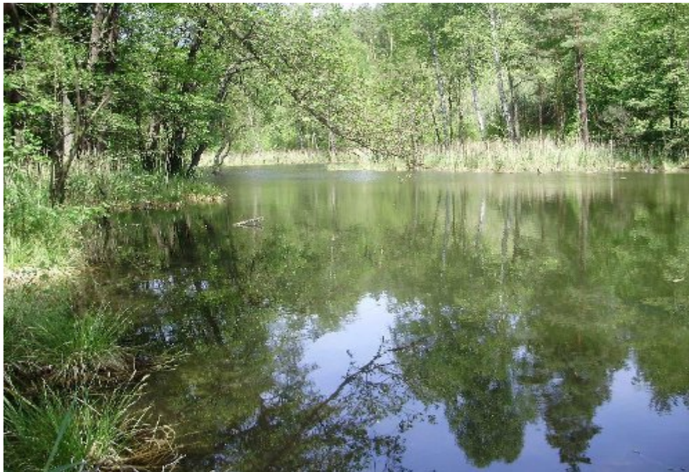
Celá tůň neupravená popadané stromy (divočina).